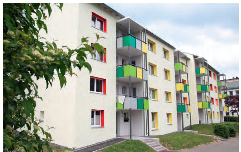
Ernst-Reuter-Straße 70, 72