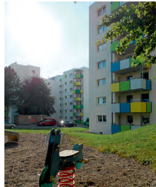
Heiligengrabfeldweg 12, 14

Die Modernisierungen der Anwesen Pinzigweg 45, 47 und Enoch-Widman-Straße 53, 55 aus dem Jahr 2014 wurden 2015 fertiggestellt. Im Geschäftsjahr 2015 modernisierten wir außerdem