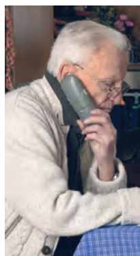
Zur Sicherheit kann man telefonisch einen Nachbarn bitten, vorbeizukommen

Das ist auch für sogenannte „Schockanrufe“ ratsam, bei denen Senioren in Panik versetzt werden, um an ihr Geld zu kommen.