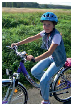
Zur eigenen Sicherheit immer einen Helm tragen

Auch wenn ein Fahrrad-TÜV fehlt, sollten die Drahtesel einmal im Jahr zum Generalcheck in die Werkstatt. Dabei werden vor allem Beleuch-