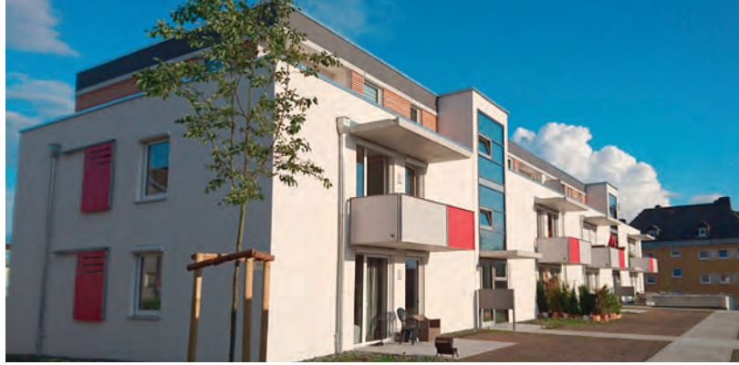
Ziegelackerstraße 1, 3